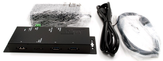
EX-K1110 - DC-Jack ~ Terminal Block